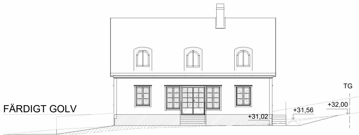
FASAD MOT SÖDER (MM3)