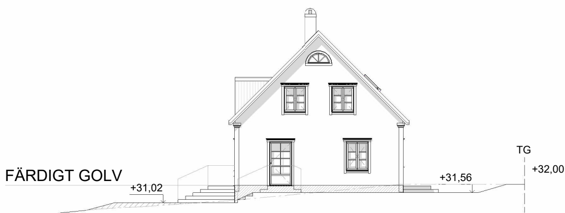
FASAD MOT ÖSTER (MM2)