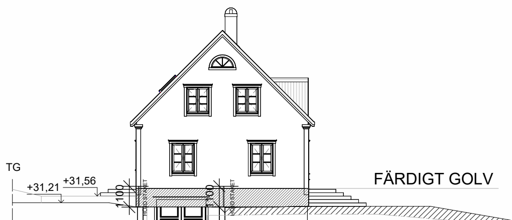
FASAD MOT VÄSTER (MM4)